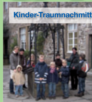
Kinder-Traumnachmittag im Schloss Hohenlimburg